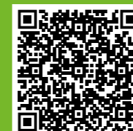
Naar Koers 2030