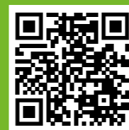
Naar jaarverslag 2023

De complete Koers 2030 kun je lezen op omo.nl .